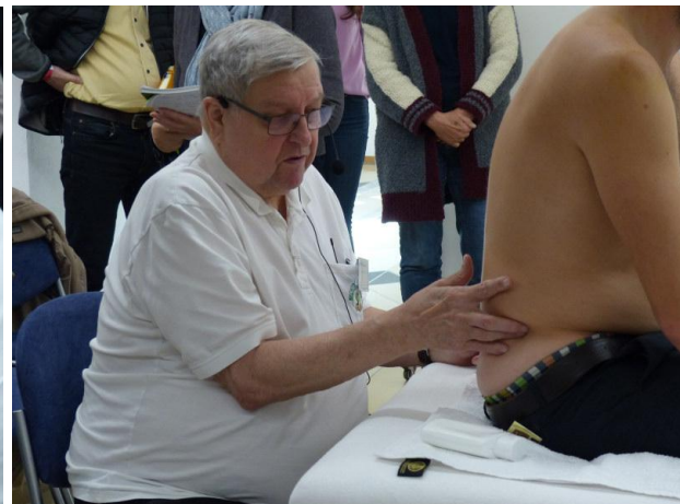
Fühlgriff - ein Finger fühlt einer drückt

Seit über 10 Jahren bin ich jetzt immer wieder mit Workshops auf den DORN-Kongressen, es macht mir immer mehr Spaß.