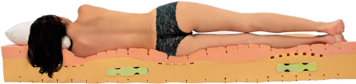
Royal Deluxe Matratze – aus Kaltschaum mit einer Sojaschaum-Auflage