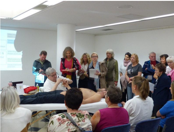
DORN Aufbauworkshop: Von der Schulter bis in die Fingerspitzen