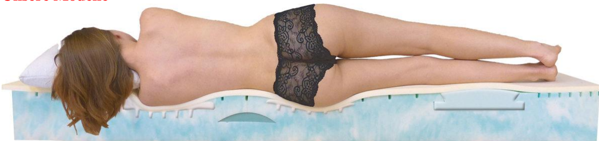
Exklusiv Comfort Matratze – aus Kaltschaum und einer Visco-Auflage