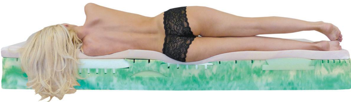
Premium Gel Matratze – aus Kaltschaum und einer Visco-Gel-Auflage