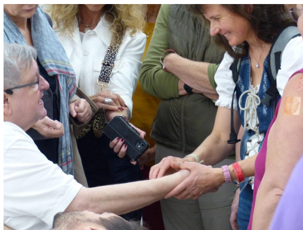
Versuch es mal