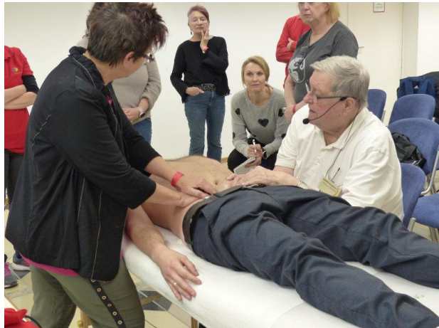
DORN Aufbauworkshop: Die Wirbelsäule dreidimensional im Tensegrity System.