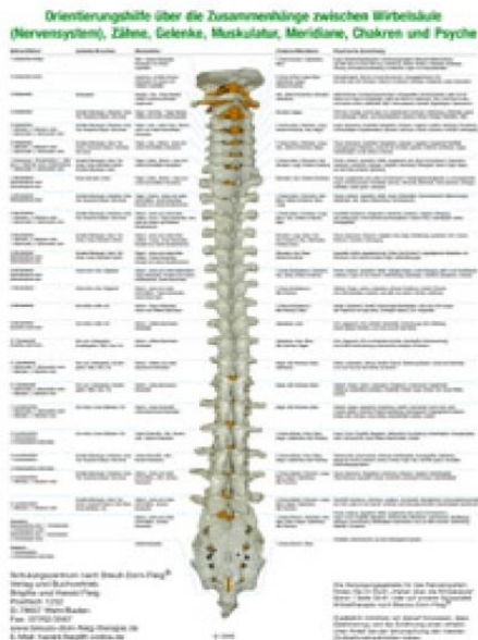
Orientierungshilfe an der Wirbelsäule

Erweiterte Informationen findet sich auf dem Poster von Harald Fleig: