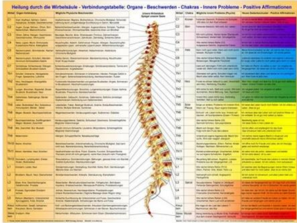
Heilung durch die Wirbelsäule

Ein weiteres Poster mit erweiterten Informationen hat Thomas Zudrell zusammengestellt: