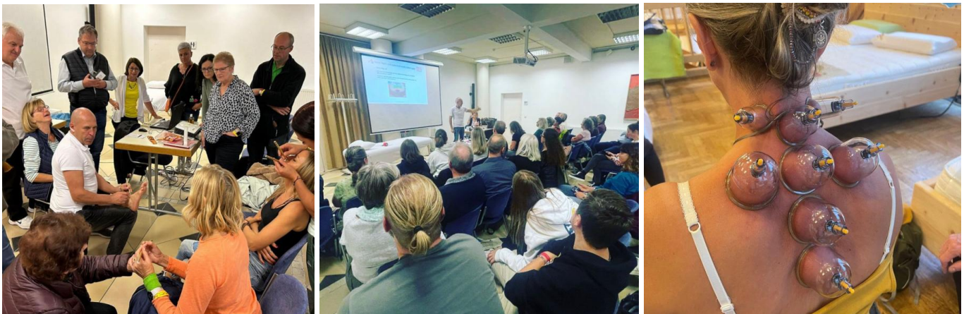
Workshops - hier vermitteln die Referenten Fachwissen und Praxis.