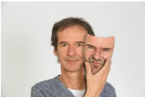
von Peter Seitz

Erleben Sie mit aktiven und passiven Techniken eine völlige Entspannung Ihres Kiefers. Das Becken, der Nacken, die Kiefergelenke, Ober- und Unterkiefer und die einzelnen Zähne sind in die 7 Übungen mit einbezogen.