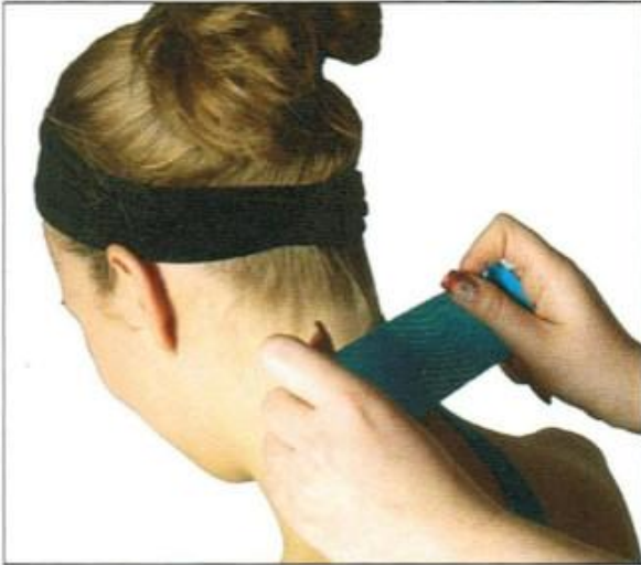
Tape zur Stabilisierung des Überganges HWS-BWS

Grundkenntnisse über kinetisches Taping - Bei "Physiocoach" oder anderen Anbietern erworben Muskeln bilden unseren "Aktiven Bewegungsapparat" und haben dabei eine Vielzahl an Aufgaben. Welche dies sind und wie mit speziellen Tests der zielgenaue Einsatz der Tapes gefunden werden kann sind die Inhalte dieses Kurses.