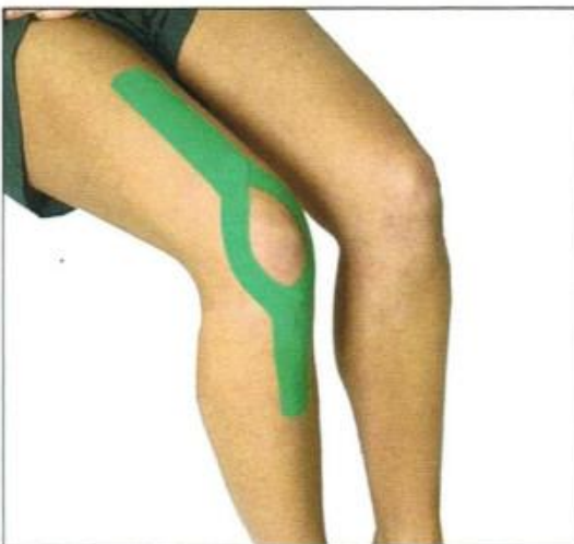
Tape des Muskulus Quadrizeps Femoris und seiner Ansatzsehne. In der die Kniescheibe eingebettet ist. Es wird angewendet zur Stabilisierung der Kniegelenkbewegung bei Schmerzen und Schwäche.

Grundkenntnisse über kinetisches Taping - Bei "Physiocoach" oder anderen Anbietern erworben Das Farbspektrum kann in ihren speziellen Wellenlängen zur Harmonisierung der Körperfunktionen eingesetzt werden. Die Kursteilnehmer lernen die Farbwirkungen kennen und die Möglichkeiten zur Austestung für eine gezielte Verwendung der Farbpalette bei unterschiedlichen Indikationen.