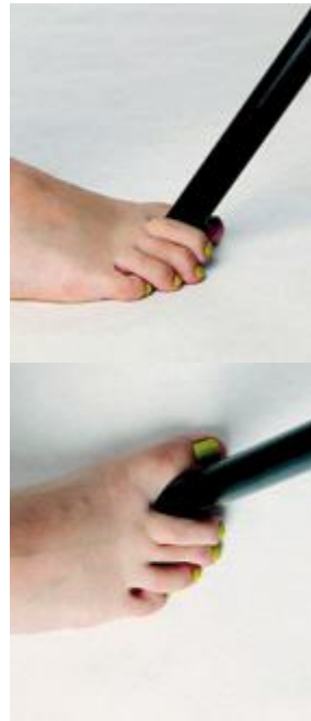
Passive Dehnung des Großzehenabspreizers, z.B. mithilfe eines Stuhlbeins