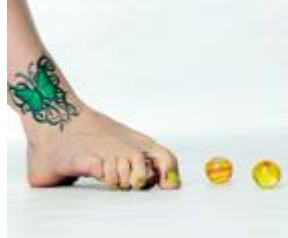
Aktivierung der Beugemuskulatur