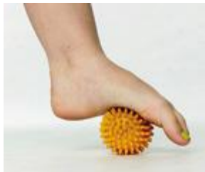
Mobilisierung des Längsgewölbes