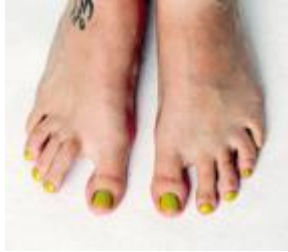
Aktive Dehnung des Großzehenabspreizers