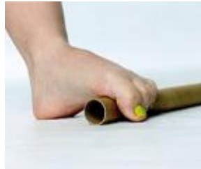
Mobilisierung des Quergewölbes