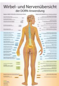
Erhard Seiler: Wirbel- und Nervenübersicht nach der DORN-Anwendung

Weitere Poster/Plakate in der Rubrik: Poster/Plakate