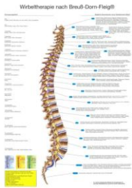
Harald Fleig: Wirbeltherapie nach Breuß-Dorn-Fleig®