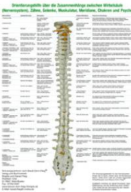
Harald Fleig: Orientierungshilfe an der Wirbelsäule