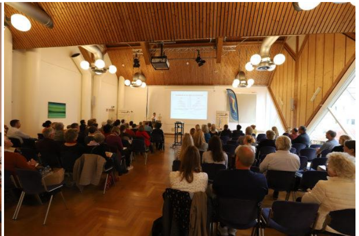
Vorträge im großen und kleinen Saal der Stadthalle Memmingen 2019.

Wir freuen uns sehr auf zahlreiche Vorschläge um auch 2023 wieder ein interessantes und abwechslungsreiches Vortrags- und Workshop-Programm zusammen stellen zu können! Gern können Sie mehrere Themen einreichen und Ihren Text auch einfach per Mail bei mir einreichen. Für Ihre Empfehlung und Weiterleitung dieser Mail an Ihnen bekannte Referenten, sind wir sehr dankbar! Wir werden dann im April über das aktuelle Vortrags- und Workshop-Programm entscheiden und Sie bald benachrichtigen.