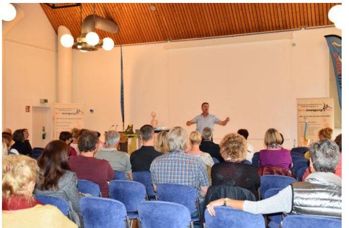
Workshops mit viel Hintergrundwissen und Praxis 2019.