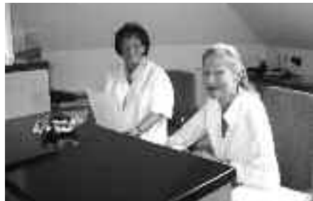
Die Damen der Anmeldung (rechts meine Frau)

Ich praktiziere daher inzwischen in einer kleinen Praxis mit wenig Personal und ohne Massenbetrieb; jeder Patient bekommt nicht nur für die erste Vorstel-