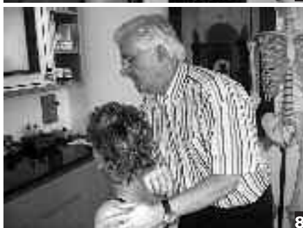
Klassische Behandlung nach Dorn