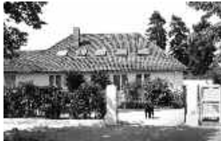
Die neue Praxis in der Schwachhauser Heerstraße

Natürlich kann die Therapie nach dieser Methode nicht im Rahmen einer großen orthopädischen Massen-Praxis stattfinden.