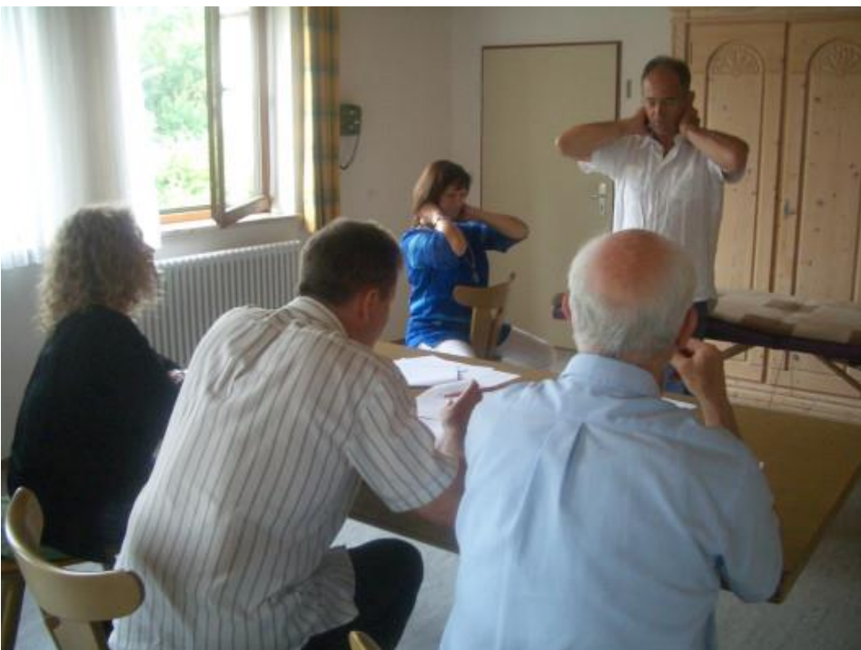
Praktische Prüfung mit Demonstration und Ausführung.

In der Praxis gilt es den Leitfaden der Anwenderschritte und die Selbsthilfeübungen der Prüfungskommission wie bei einem Seminar zu demonstrieren und zu vermitteln.