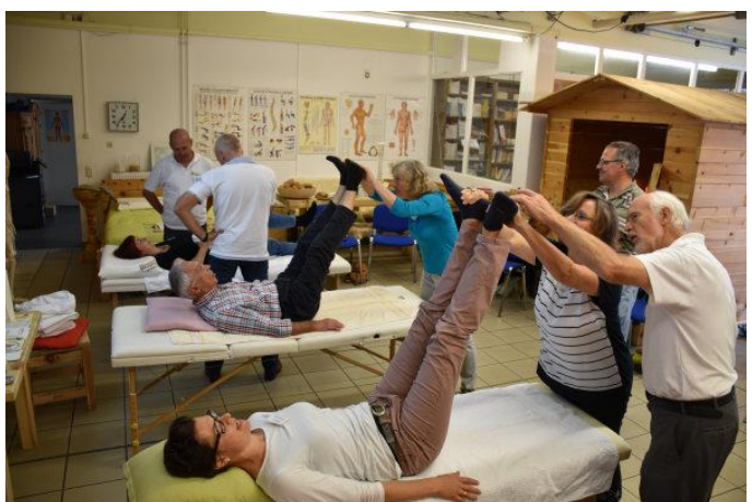
Die Theorie und Demonstration des Beinlängentestes machen einen Teil der Veranstaltung aus. Ein weiterer Hauptschwerpunkt liegt in der praktische Durchführung und dem Gegenseitigen Üben.