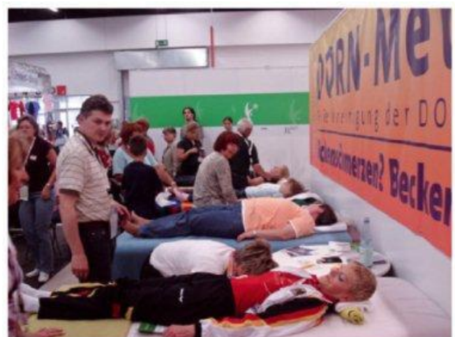
Der enorme Andrang erforderte weitere Behandlungsplätze auf dem Deutschen Turnerfest 2009 in Frankfurt.