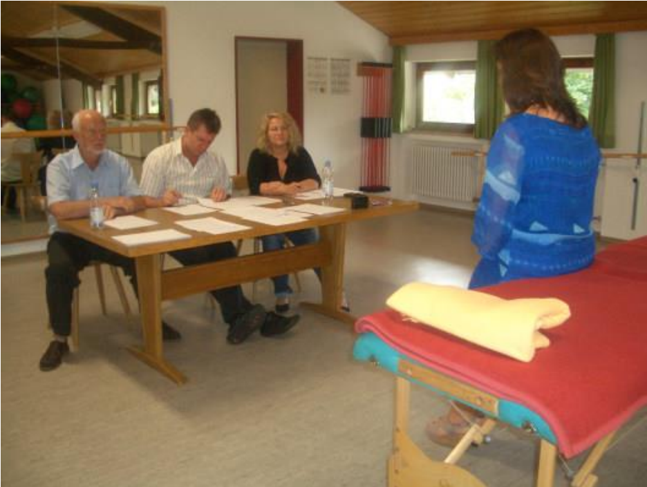
Mündliche theoretische Prüfung vor einem Prüfungsausschusses aus drei Mitgliedern der Prüfungskommission.

In der Theorie wird die Geschichte, Grundlagen, Prinzipien, Philosophie, Grenzen von DORN, sowie das Basis-Wissen in Anatomie in Bezug auf DORN erwartet. Die rhetorische Fertigkeit Selbsthilfeübungen, Vorgehensweisen beim Aufzeigen von Dysbalancen und die Eigenverantwortung zu vermitteln und erklären zu können, sind Grundfähigkeiten, die an einen Ausbilder gestellt und in der Prüfung überprüft werden.