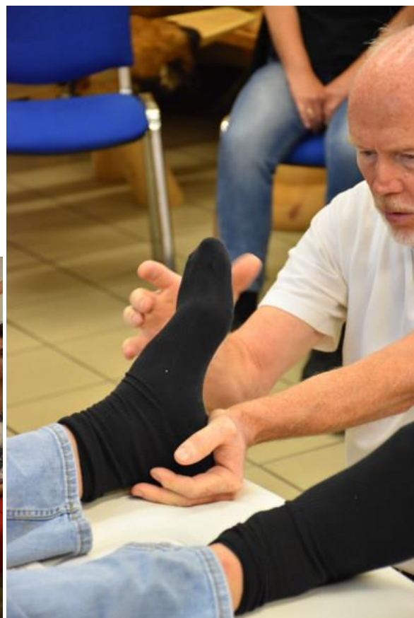
An jedem Gelenk am Bein werden die einzelnen Abläufe erklärt, demonstriert um die Vorgehensweise bei der Beinlängenkontrolle und -korrektur Schritt für Schritt nachvollziehen zu können.