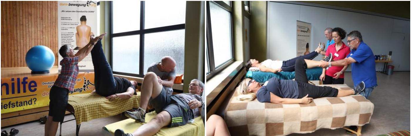
In der Praxis mit gegenseitigem Üben kann jeder die DORN-Anwendung und die Selbsthilfeübungen erfahren und an sich selbst spüren.