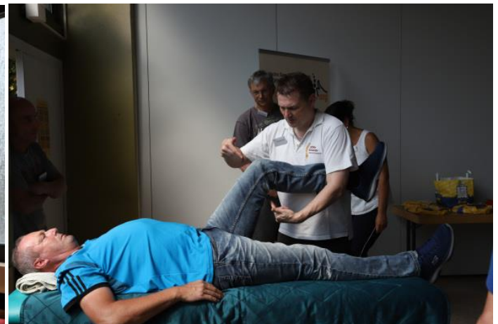
Anschauliche Vermittlung von Basis- und Hintergrundwissen.