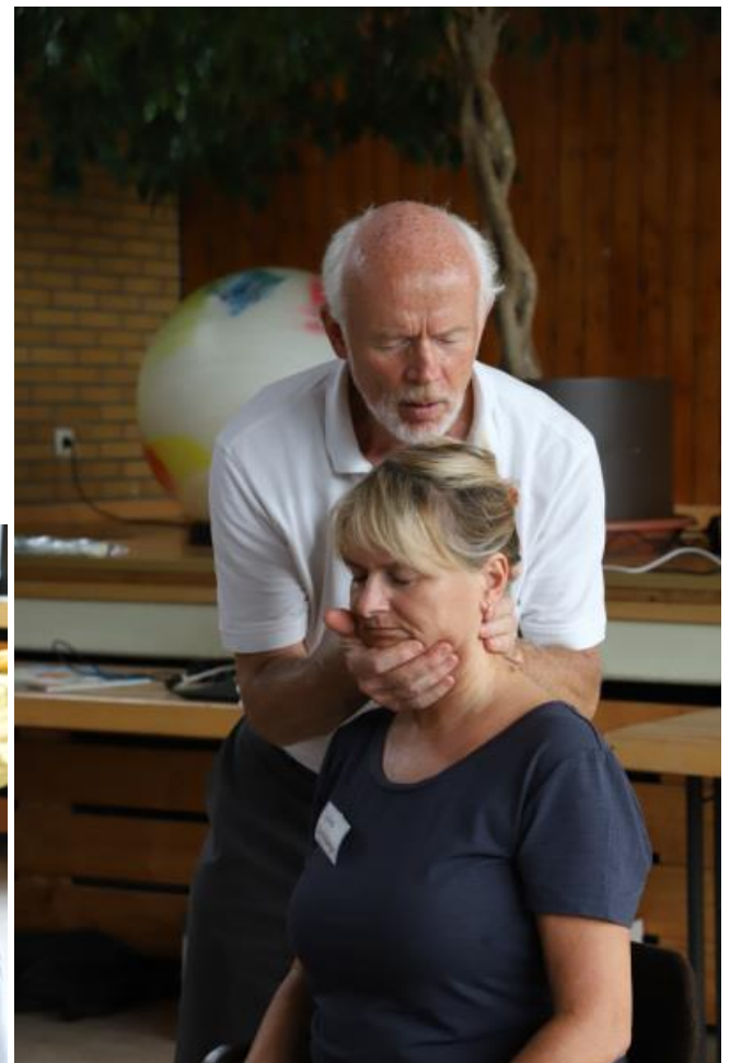
Sensibles Ertasten von Dysbalancen und das feinfühligesetzen von Impulsen sind die grundlegenden Merkmale der DORN-Anwendung.