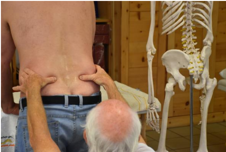
Bei der weiteren Vorgehensweise werden Dysbalancen und Asymetrien aufgezeigt und die Ursachen und Hintergründe erklärt.