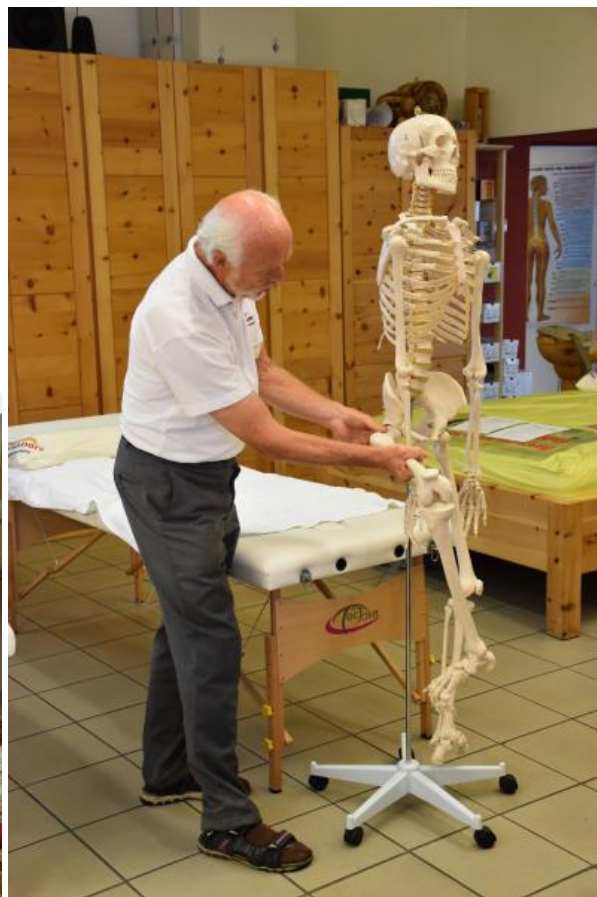
Anschauliche Vermittlung von Basis- und Hintergrundwissen bei der Beinlängenkontrolle und -korrektur.