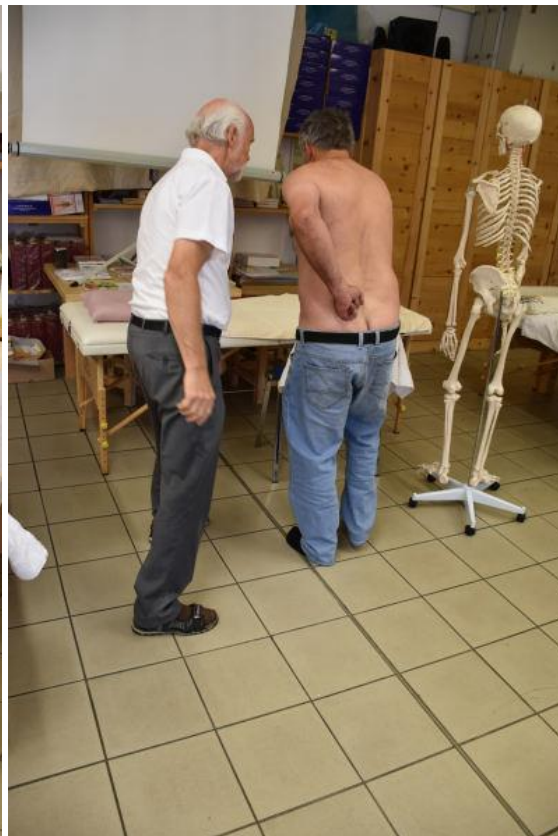
Mit sanften Impulsen in der Bewegung in die natürliche Position wird das System mobilisiert und stabilisiert. Der Klient wird sich seiner Energien besser gewahr und lernt mit Irritationen, auch der Nervenbahnen, umzugehen. Das Aufzeigen und die Anleitung zur Selbsthilfe sind einer der wichtigsten Grundsätze von DORN