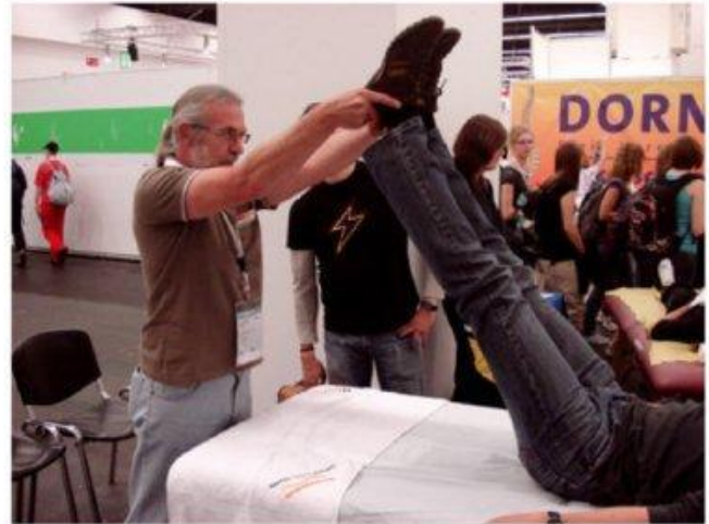
Demonstration der Beinlängendifferenz und -korrektur auf dem Deutschen Turnerfest 2009 in Frankfurt.