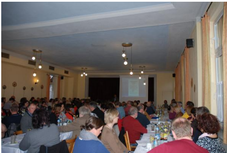
110 Teilnehmer der Gründungsversammlung füllten den Saal im Gasthof Rössle

Die Beschlussfähigkeit wurde mit 110 teilnehmenden Gründungsmitgliedern festgestellt.