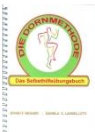
Erwin F. Wagner / Daniela C. Langellotti "Die Dornmethode - Das Selbsthilfeübungsbuch"

Unser Gesamtprogramm mit allen Produkten finden Sie unter: