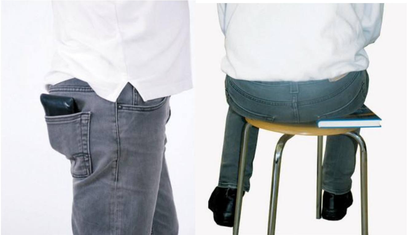
Sitzen mit der Geldbörse in der Gesäßtasche verursacht längerfristig einen Beckenschiefstand.

Dadurch, dass Betroffene ihr Knochengerüst einseitig belasten, kann es zu einem Beckenschiefstand und verschobenen Wirbeln kommen. Das ganze System gerät aus den Fugen. Oft sind Blockaden in Knie- und Sprunggelenken oder im Hüftgelenk die Ursache für eine Beinlängendifferenz, allerdings können auch diverse Fehlhaltungen im Alltag dazu führen: das Sitzen mit übereinander geschlagenen Beinen oder das Tragen des Geldbeutels in der hinteren Hosentasche. Solche Fehlerquellen sollten, wenn möglich, vermieden werden.