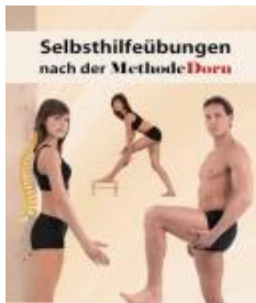
Selbsthilfeübungen der Dorn-Methode