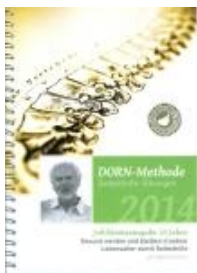
Helmuth Koch "Selbst-Übungen der DORN-Methode"