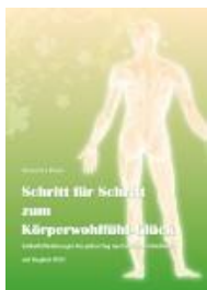
Natascha Blum "Schritt für Schritt zum Körperwohlgefühl-Glück"